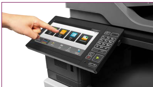
Interface utilisateur intuitive et simple d'utilisation.

Nos matériels sont équipés d'un panneau de commande tactile* offrant une interface utilisateur intuitive donnant un accès direct aux fonctions les plus utilisées. Vous pouvez également personnaliser l'écran pour l'adapter à votre propre façon de travailler : il vous suffit de glisser-déposer les icônes des menus afin de les installer où vous le souhaitez.